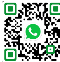
TA São Luís (MA)