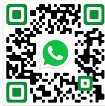
TA Belém (PA)