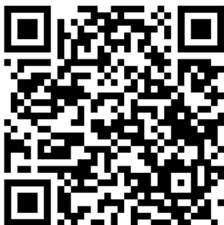
Acesse o QR-Code acima para curtir a página no Facebook